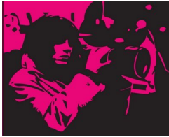
Cine Club Las Mal - pensantes