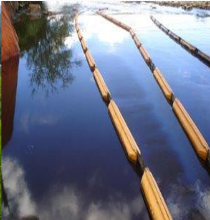
Agua que entra a Cúcuta para el Consumo humano