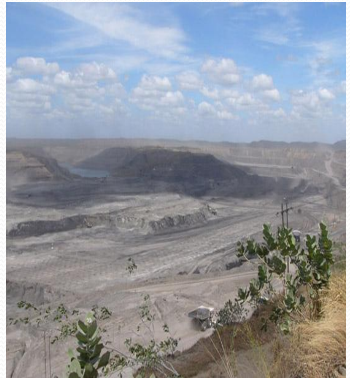
Desertización de la región consecuencia de la explotación del carbón