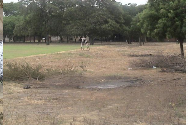
Deterioro ambiental de un centro universitario del país