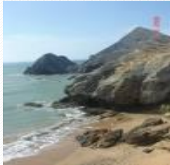
Playas de la Península de la Guajira