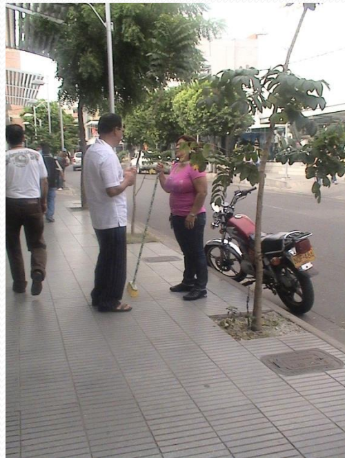
Zona comercial de la ciudad, un ejemplo de cultura ambiental