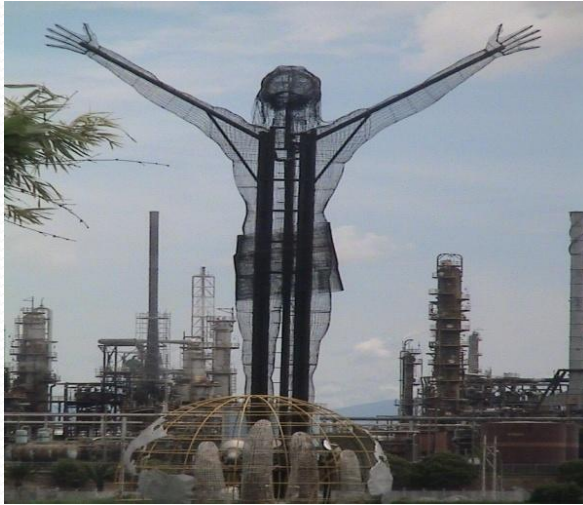
Cristo Petrolero - Ecopetrol