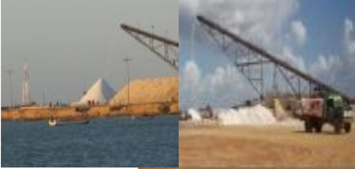
Riqueza de recursos naturales y la sobre explotación de sal