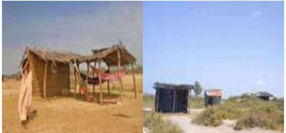
Condiciones de calidad de vida