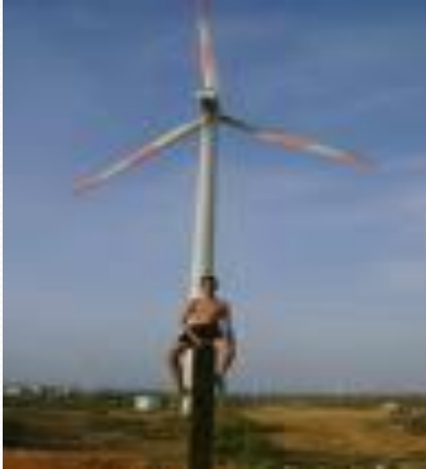
Sistema de energía eólica