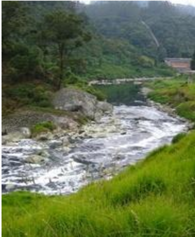
Río Pamplonita – a la salida de la ciudad de Pamplona