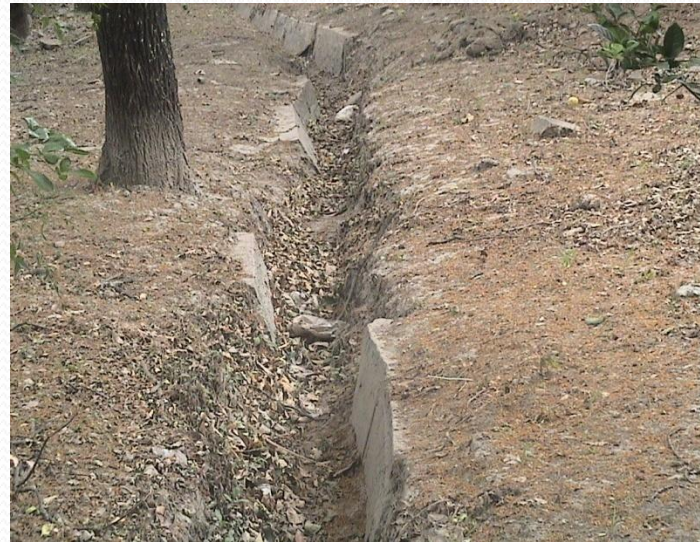
Reflejo de la indiferencia de la comunidad universitaria