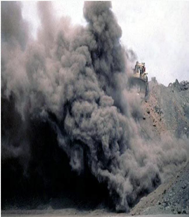
Explotación de carbón del cerrejón