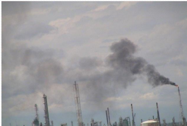
Refinerías y sus emisiones