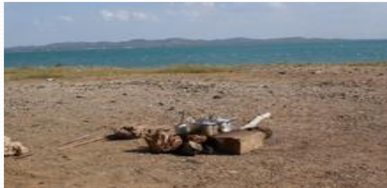
Zonas desérticas por agotadas por efectos entrópicos