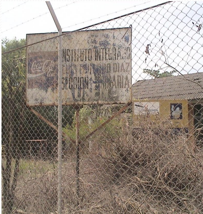
Instituto integral Luis Eduardo Díaz