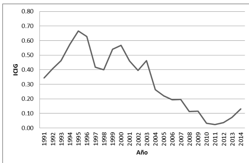
Gráfica 1. Tendencia del ICIG del Valle del Cauca con Ecuador 1991 - 2014