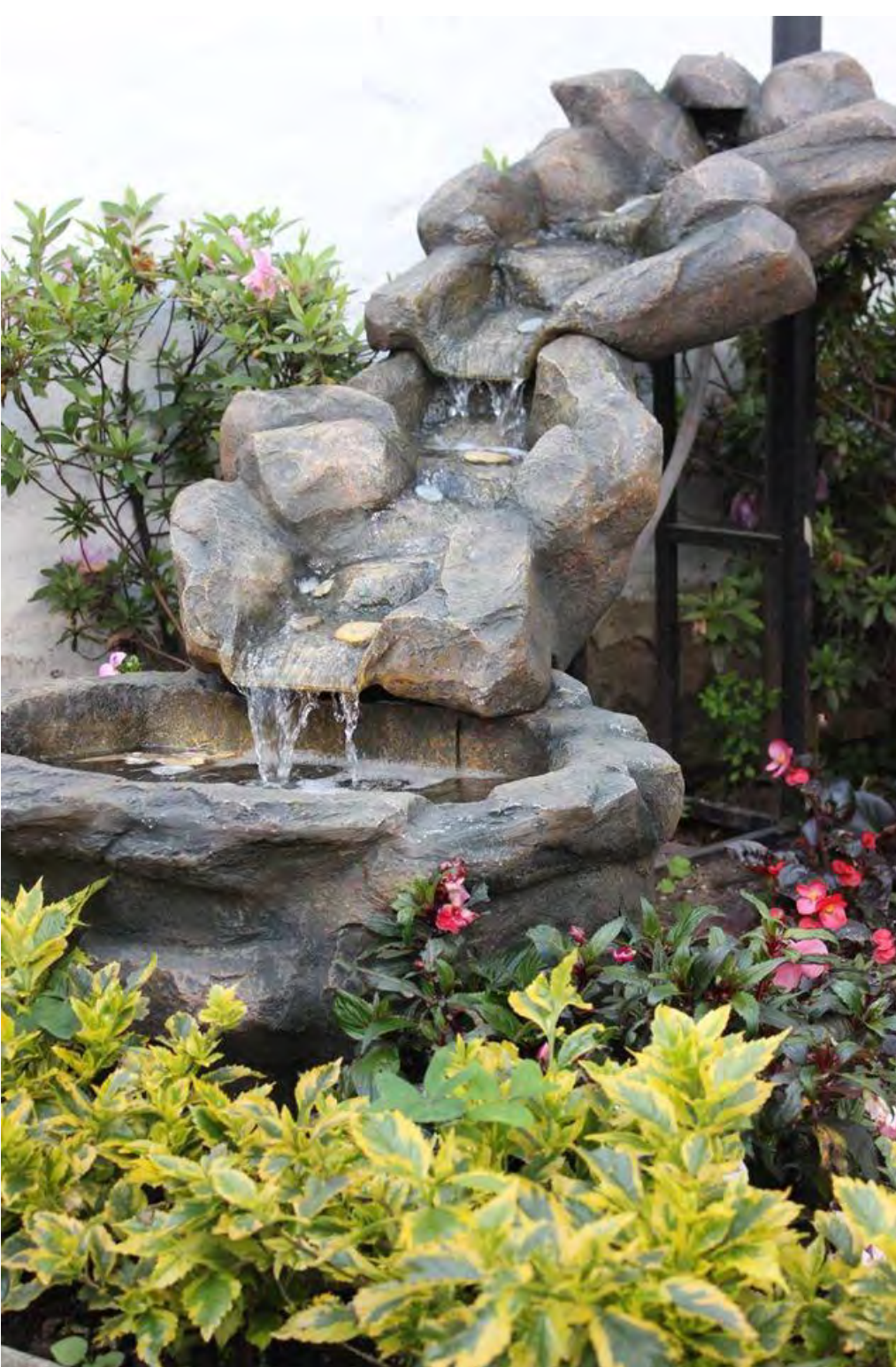
Nombre foto: Fuente de Relajación Autor: Gabriela Alejandra Romero Vásquez. Estudiante de Derecho.