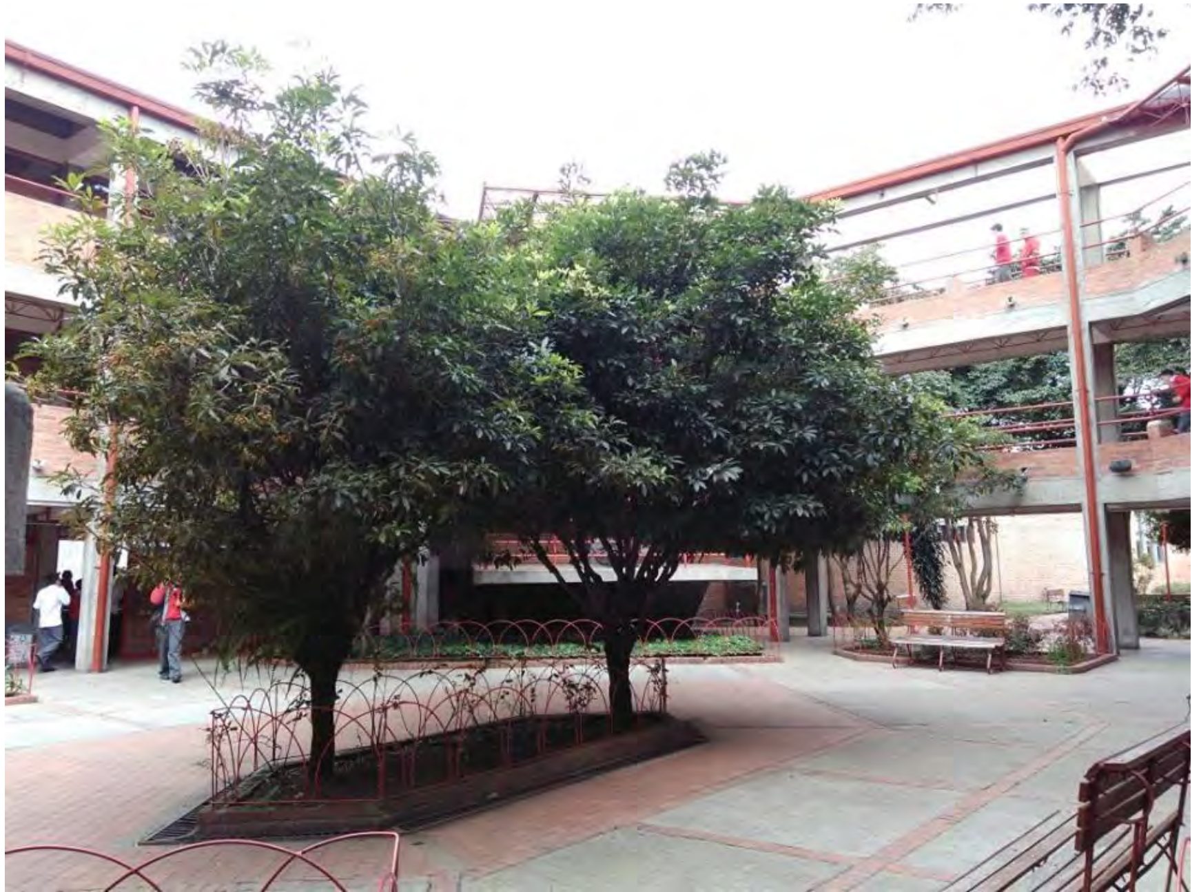
Nombre foto: Educación y Universidad Autor: Nicolás Moreno Giraldo