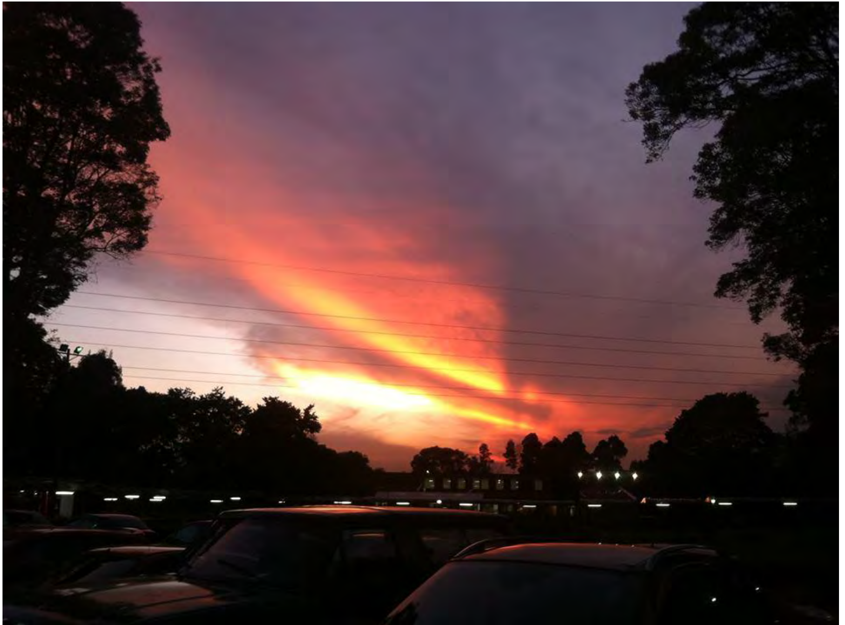
Nombre foto: Auge del Ocaso Autor: Daniel Ibáñez Morales Estudiante Ingeniería Industria