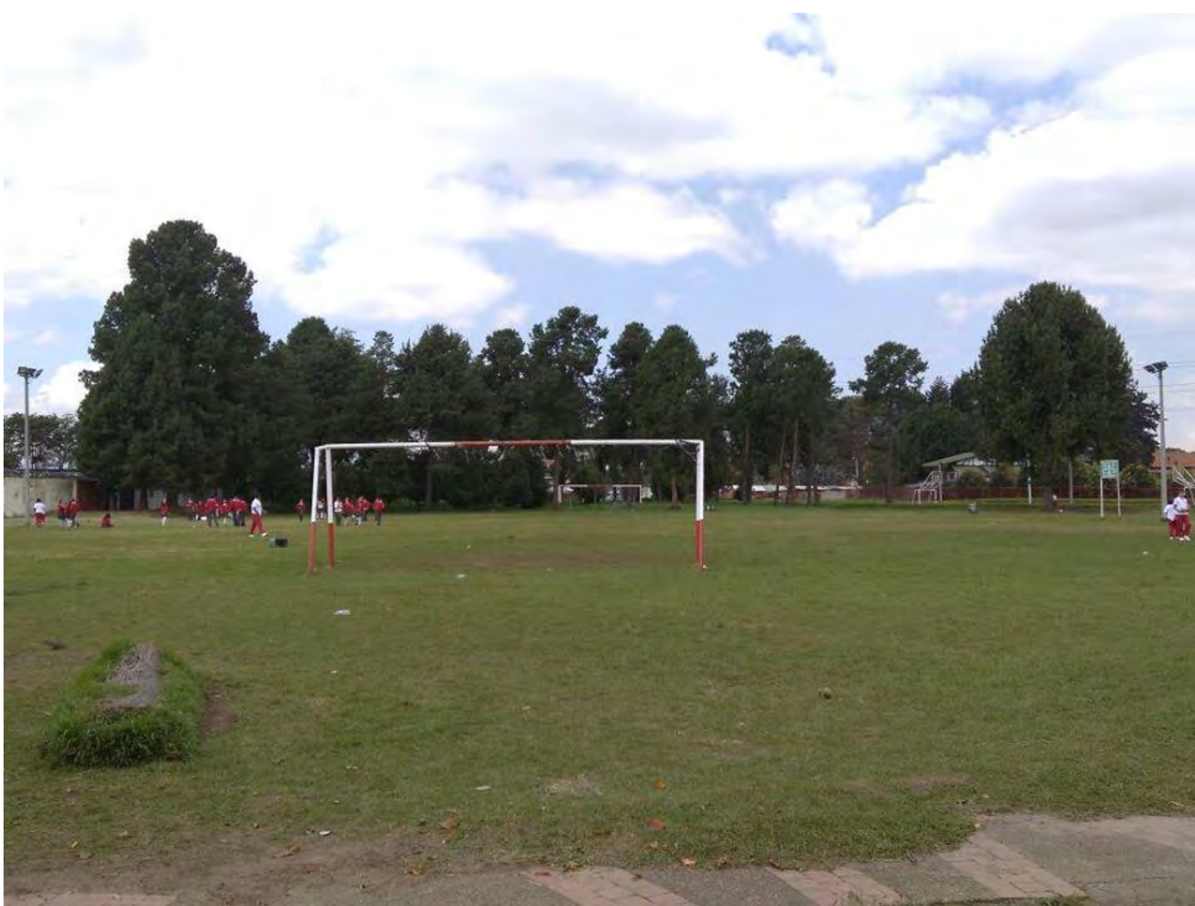
Nombre foto: Mi Deporte