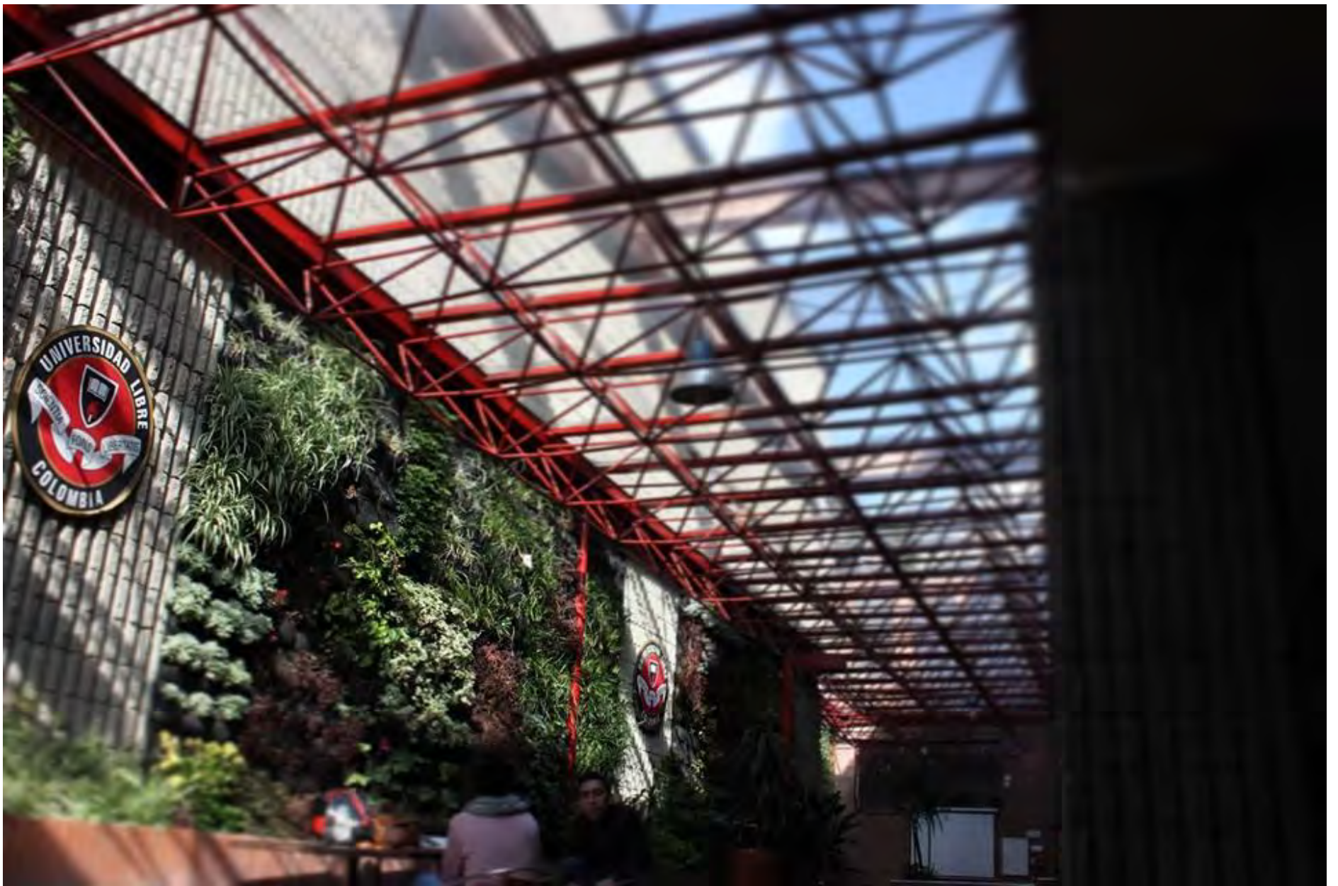
Nombre foto: Perspectivas ambiental Autor: Milton Armando Cortes Cerquera Estudiante