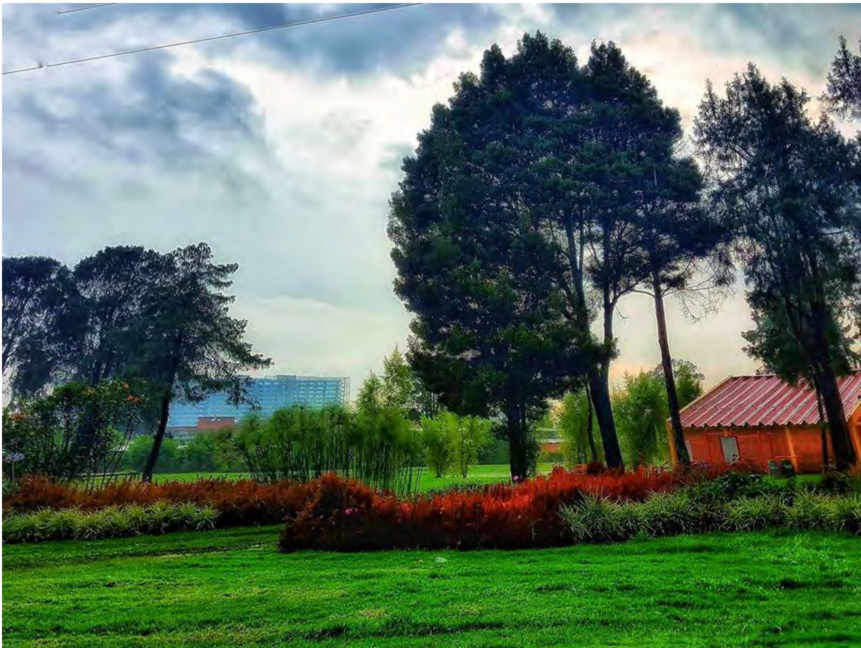
Nombre foto: Zona Verde Autor: Liby Rodríguez Ayala Estudiante de Ingeniería Industrial