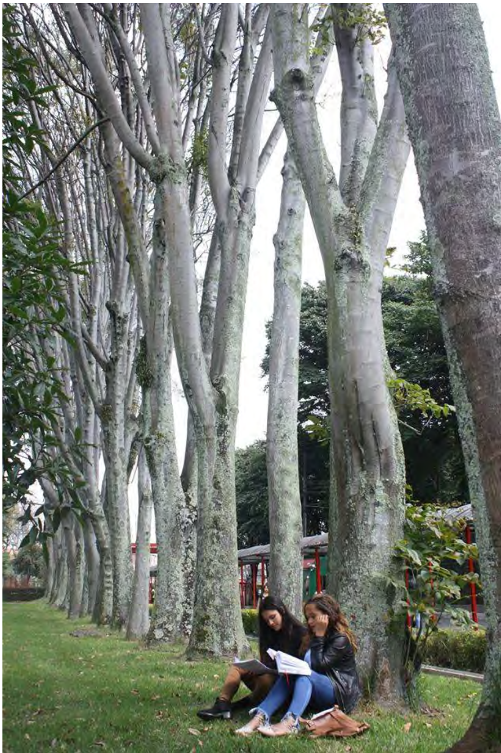
Nombre foto: sobras confidentes Autor: Pablo Nicolás Castillo Monroy Estudiante de Derecho