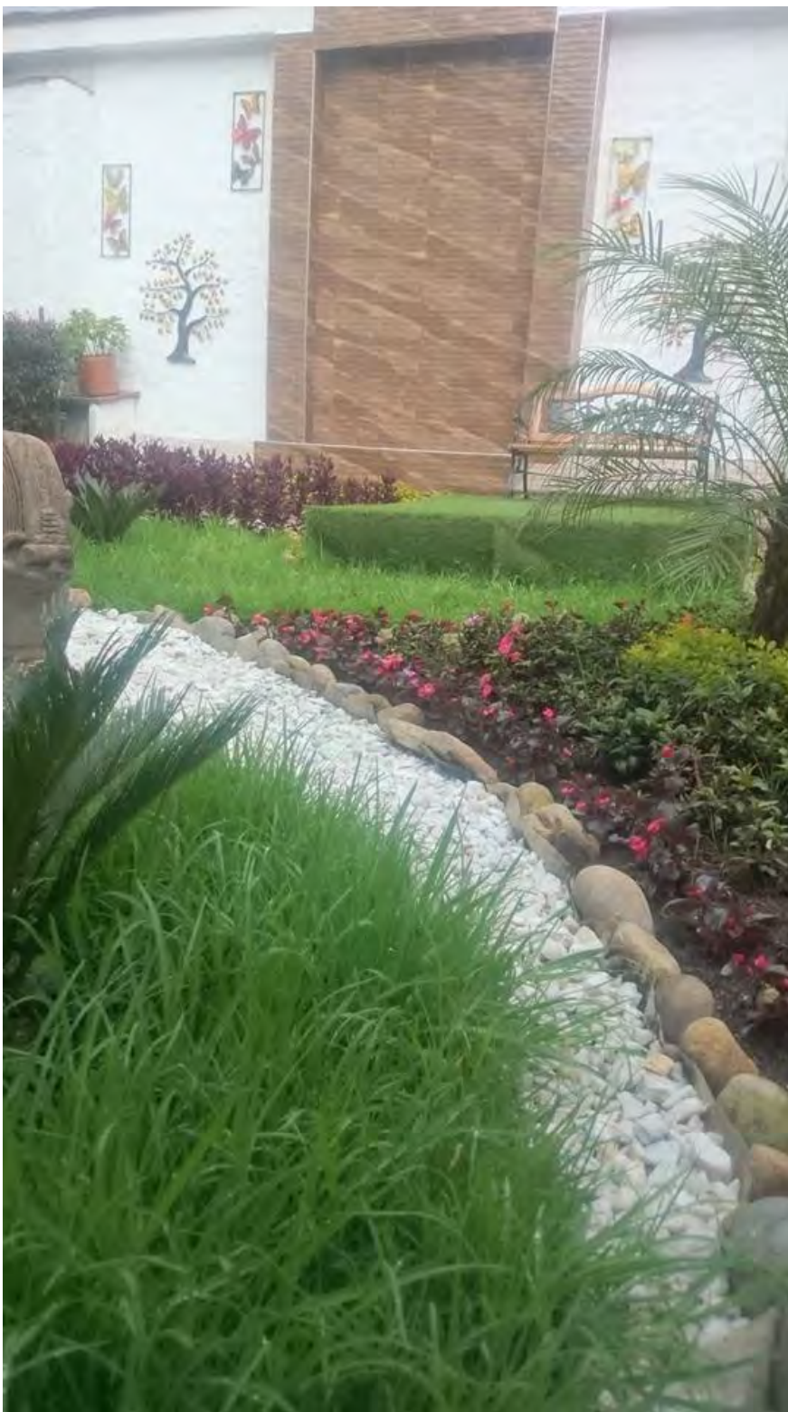
Nombre foto: Caminito Autor: Giovanni Alarcón Administrativo