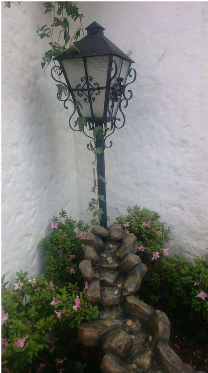
Nombre foto: Luz y Vida