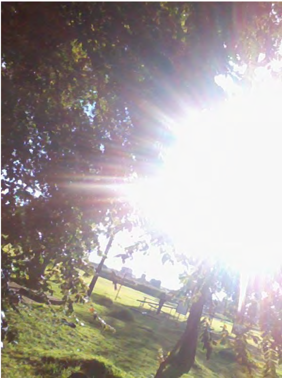
Nombre foto: Mientras cae el sol Autor: Luis Francisco Fonseca Estudiante Ingeniería Mecánica