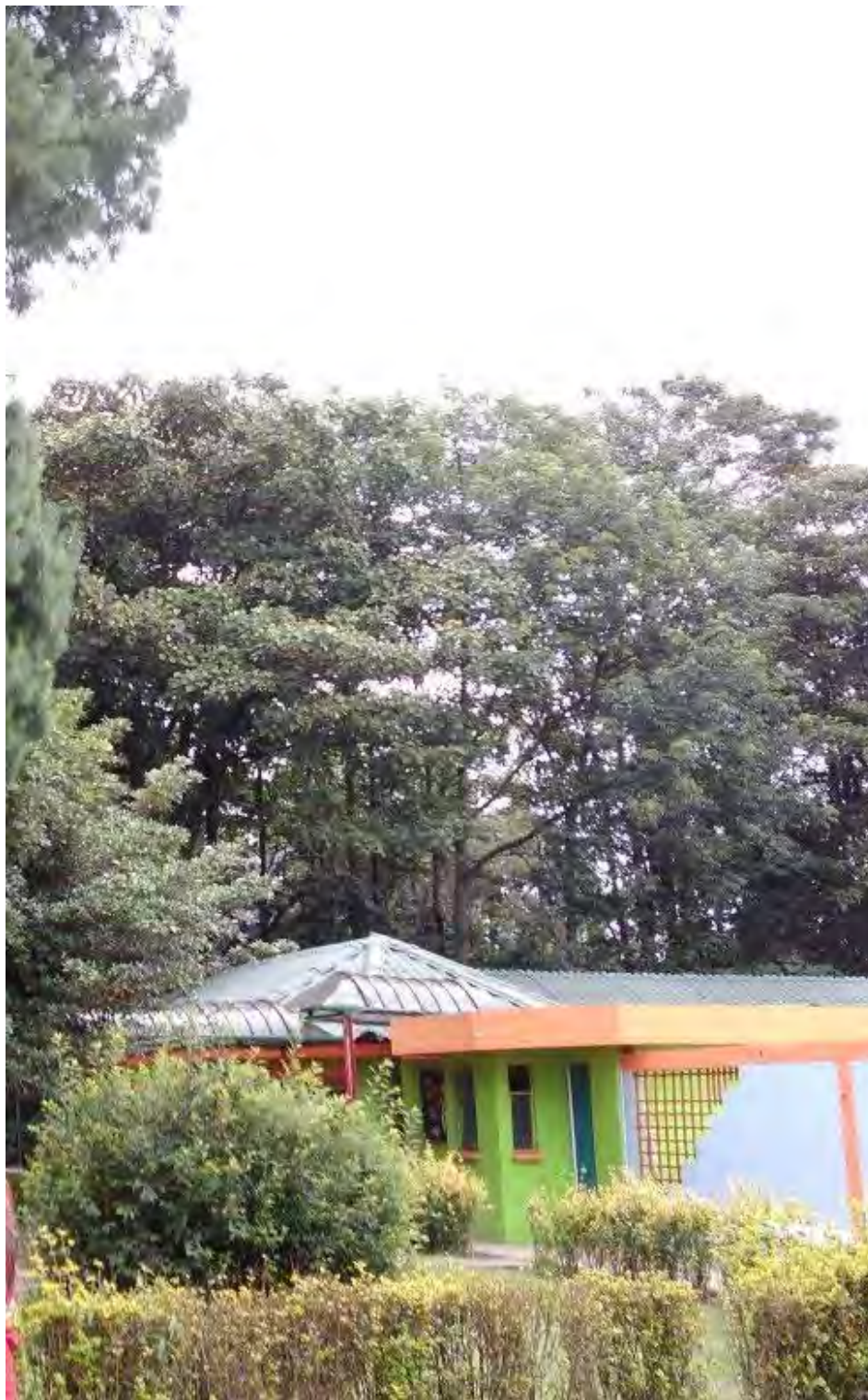
Nombre foto: Mi colegio Autor: Nicolás Moreno Giraldo