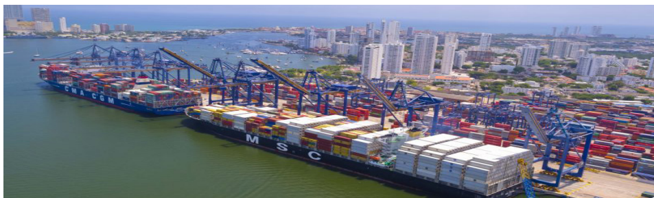
Puerto de Cartagena.

El panorama de los puertos de Cartagena, Barranquilla y Santa Marta en cuanto a los objetivos de cada uno y las ventajas que los diferencian tienen relevancia en el desarrollo de la competitividad de las economías globales en materia comercial, económica, política y social y los problemas encontrados en los tres puertos durante la visita realizada y la explicación de cómo afectan la eficiencia de procesos, costos asociados y oportunidades en los mercados extran-