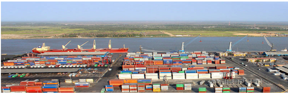
Puerto de Barranquilla

Puerto de Cartagena para el año 2019 movilizó 4.8 millones aproximadamente, incluyendo a Contecar; el Puerto de Barranquilla, mientras que, durante el año 2018, se atendieron 737 motonaves que representaron 1.353.000 toneladas de contenedores, 742.000 toneladas de carga general, 1.946.000 toneladas de granel y 1.194.000 toneladas de coque; siendo la terminal que movilizó la mayor cantidad de este último producto en el país. ( www.puertodebarranquilla.com )