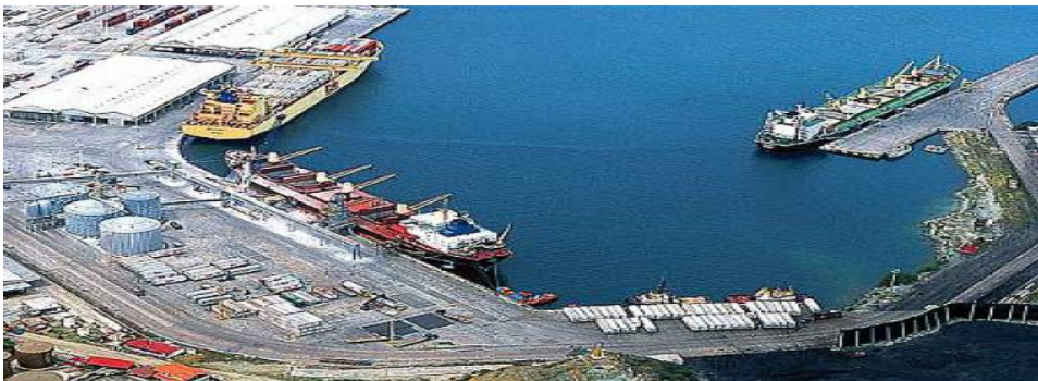
Puerto de Santa Marta

https://www.eltiempo.com/colombia/otras-ciudades/progreso-del-puerto-de-santa-marta-30354 El Puerto de Santa Marta se consolida como uno de los mejores del Caribe colombiano.