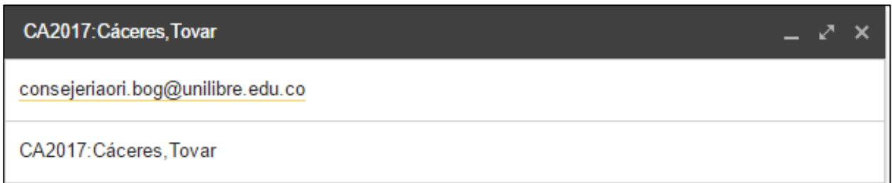
Figura 1.1 Ejemplo del asunto

La entrega del ensayo debe realizarse en medio magnético y en formato PDF al siguiente correo electrónico: consejeriaori.bog@unilibre.edu.co . El correo debe llevar el siguiente asunto: CA2017: Primer apellido completo, segundo apellido completo. (Ver figura 1.1.)