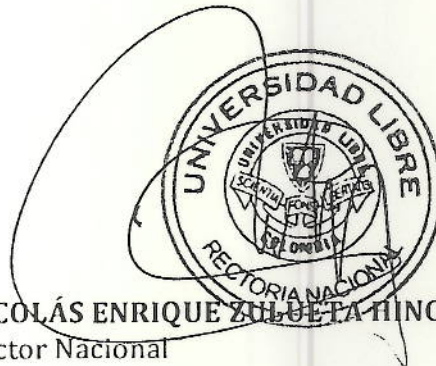
NICOLÁS ENRIQUE ZULUETA HINCAPIE. Rector Nacional