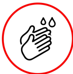
Desinfección de manos