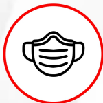
Uso de tapabocas

Recuerda cumplir con estos pasos antes de ingresar a esta sala: