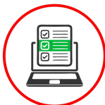
Diligenciamiento de encuesta diaria

Puedes escribir a seguridad.salud.pei@unilivre.edu.co inquietudes relacionadas a nuestro protocolo de bioseguridad.