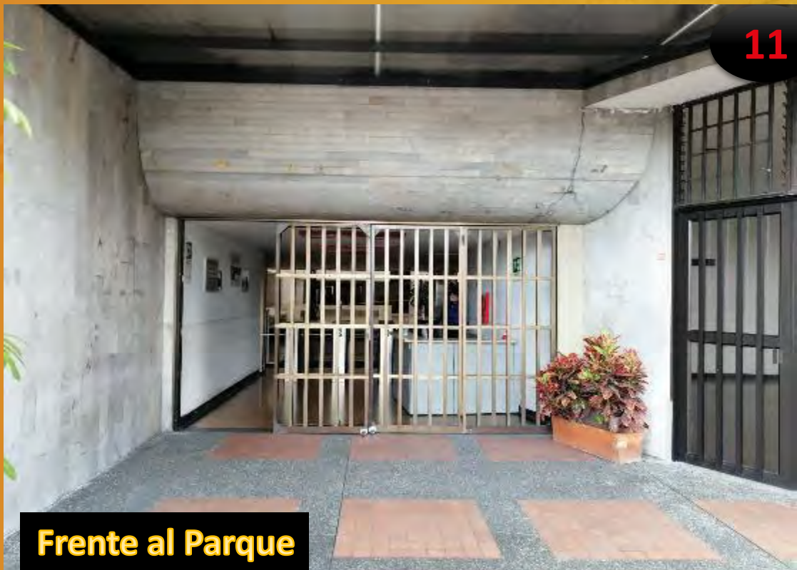
Frente al Parque