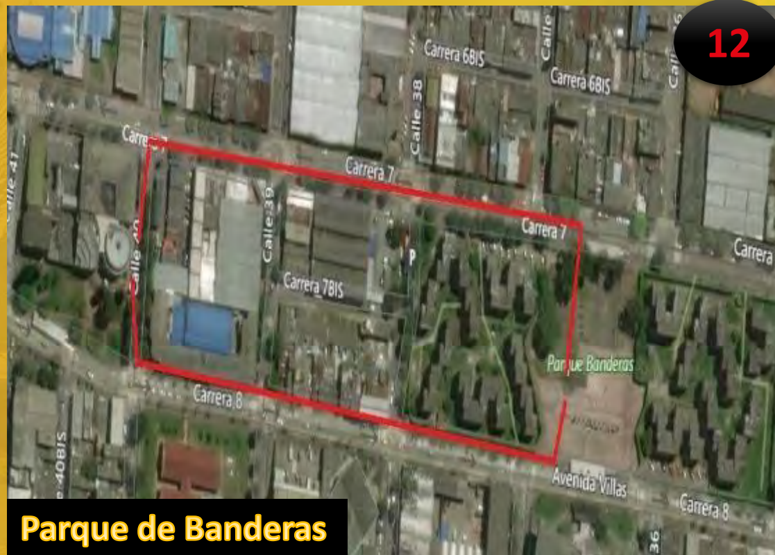
Parque de Banderas