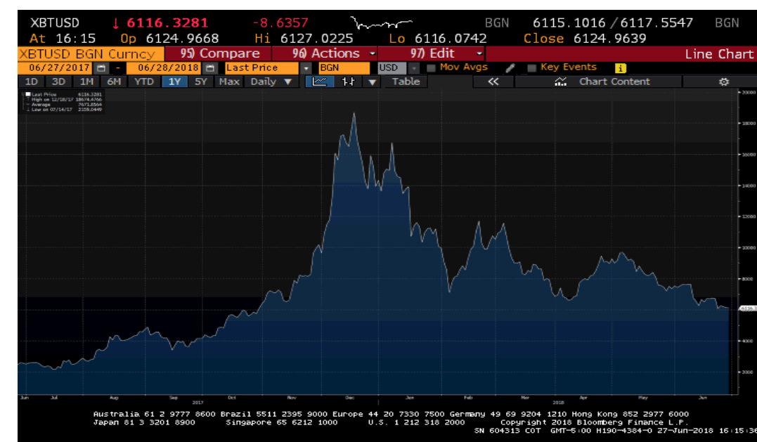
Figura No. 1. Comportamiento del bitcoin del 27 de junio de 2017 al 28 de junio de 2018

La CM más negociada en el mercado de las criptodivisas es el bitcoin; para tal efecto a continuación se muestra el comportamiento que ha tenido ésta durante el último año.