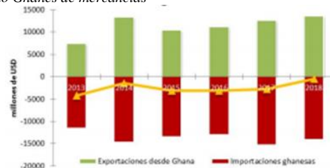
Figura II Comercio Ghanés de mercancías

Como se evidencia en la gráfica, Ghana es un país principalmente importador especialmente en temas de maquinaria y transporte, Su principal fortaleza a nivel internacional es la exportación del Oro y Cacao llegando inclusive a tener influencia en los precios de estos [13].