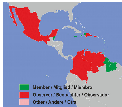
Imagen 1. Miembros observadores y asociados al Caricom

Antigua y Barbuda, Bahamas, Barbados, Belice o Belice, Dominica, Grenada, Guyana, Haití, Jamaica, Montserrat, Saint Lucía, St Kitts and Nevis, St Vincent and The Granadines, Surinam y Trinidad y Tobago. La gran mayoría son del Mar de las Antillas; de los anteriores países las Bahamas hacen parte de la Comunidad, pero no del Mercado Común, tiene otros miembros asociados como son: Anguila, Islas Caimán, Caicos, Islas Turcas e Islas Vírgenes. Los países que se les considera observadores del Caricom están: Colombia, Aruba, México, Puerto Rico, Curazao, San Martín, Venezuela y República Dominicana. Al parecer no había plena aceptación de San Martín, República Dominicana y Venezuela fueron admitidos como observadores a partir del 2018. No está Cuba por su Sistema Cerrado de gobierno.