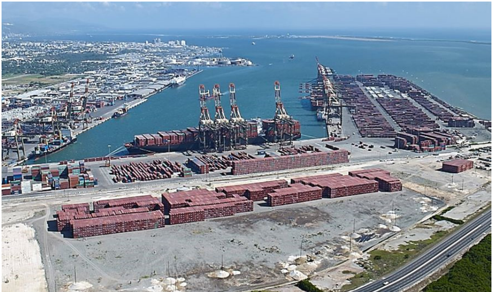
Imagen 6. Panorámica de Kingston y su Puerto

cas con más de 2,2 millones de contenedores que moviliza anualmente. Tiene otros más uno orientado hacia el petróleo y otro hacia el cemento, otro llamado Flour Mills con vocación granelera.