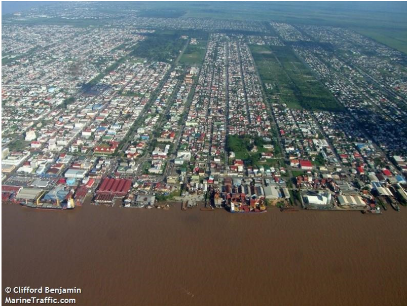
Imagen 4. Puerto Marítimo de Georgetown

de contenedores, aunque también opera para graneles.