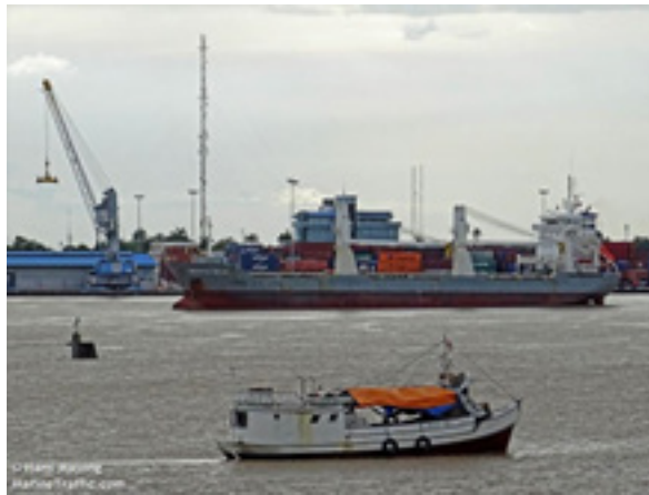
Imagen 7. Puerto de Paramaribo

metros cuadrados, con densidad de 3 habitantes por kilómetro cuadrado, dependen de la producción de aluminio y petróleo, tiene diferendos limítrofes con Guyana, con 9.070 millones de dólares en su PIB, entre sus principales Puertos están Paramaribo, Albina, Paranam, Moengo, Nieuw Nickerie y Wageningen, algunas embarcaciones de calado medio llegan a entrar por sus ríos, que es la gran fortaleza de esta Guayana Holandesa. El Puerto es multipropósito, ya que pueden descargar mercancía contenedorizada, paletizada y al granel.