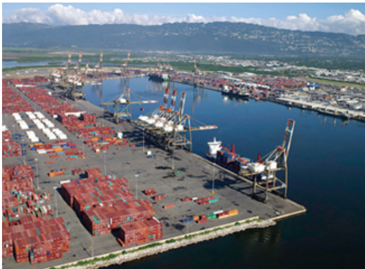
Imagen 5. Puerto de Kingston en Jamaica

En el Caribe Insular y con más de 3 millones de habitantes, cuya capital y más densamente poblada se denomina Kingston y una extensión de 10.991 kilómetros cuadrados y densidad poblacional de 266 habitantes por kilómetro cuadrados y un PIB que supera los 27.000 millones de dólares es una de las Islas del Caribe que tiene mejor calidad de vida. Su economía depende del petróleo, derivados, bauxita, turismo, en el especial el etnoturismo ya que todos los turistas quieren saber de su música y de sus grandes intérpretes. Como otras islas del Caribe, también se produce azúcar o caña de azúcar, café, pimienta y tabaco, cannabis, cemento, textiles, entre otros productos, aunque varios de los productos son para consumo interno.