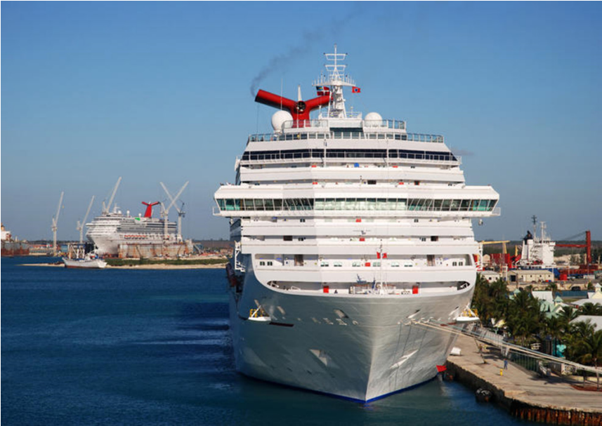
Imagen 3. Freeport Puerto de cruceros en Bahamas