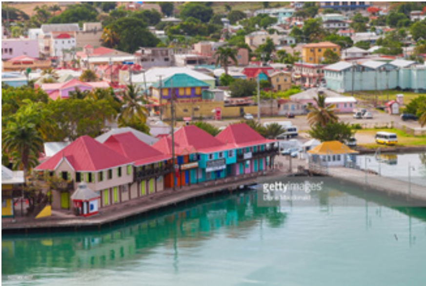
Imagen 2. Saint John