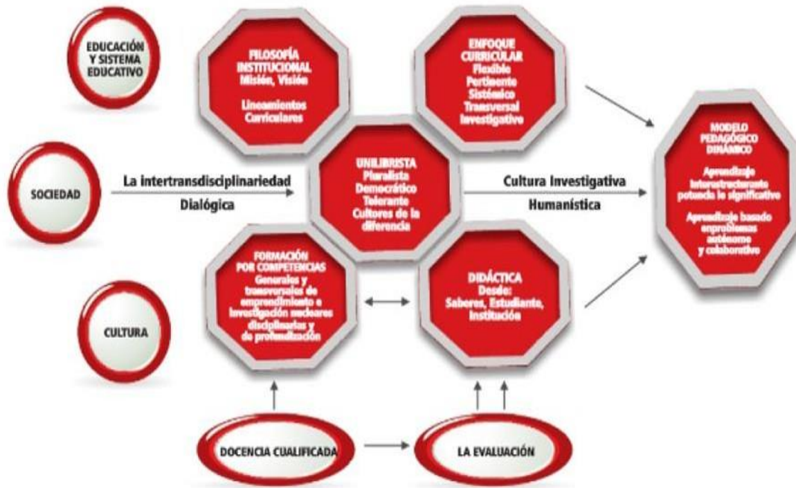
Figura 1. Estructura del enfoque pedagógico institucional