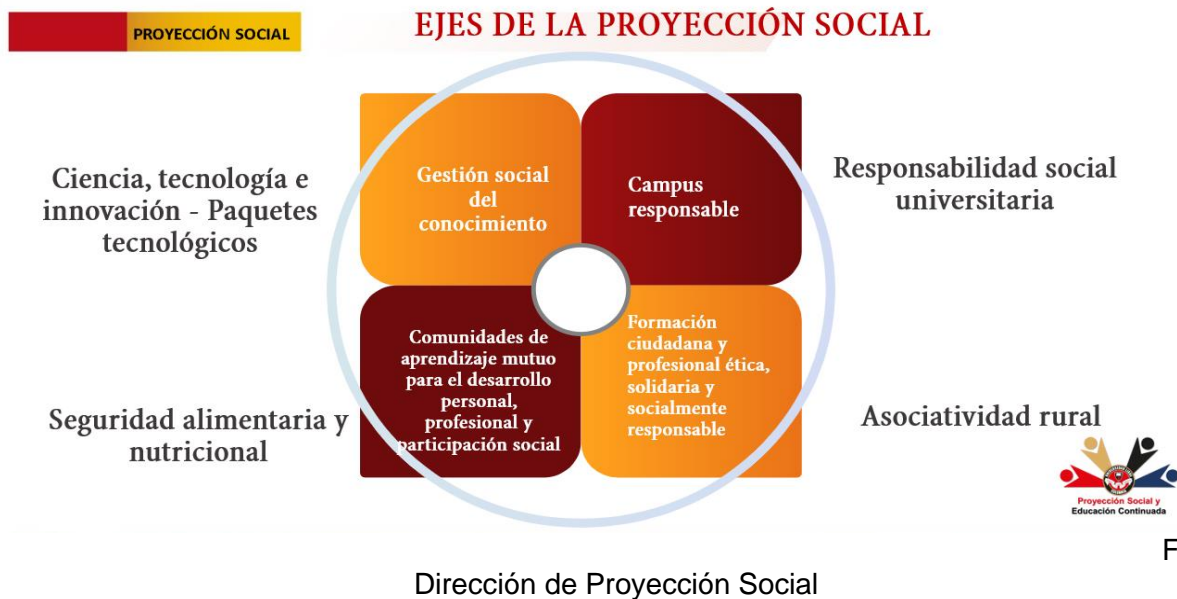
Figura 6. Ejes de la Proyección Social en la Universidad Libre

Objetivos: Crear y mantener un programa para establecer una relación recíproca y un vínculo permanente que fortalezca, por un lado, el sentido de pertenencia del egresado frente a la universidad, y por el otro, los procesos de formación de la institución mediante la retroalimentación de sus egresados