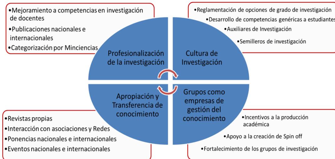
Figura 4. Modelo de gestión de la investigación aplicado en la Facultad