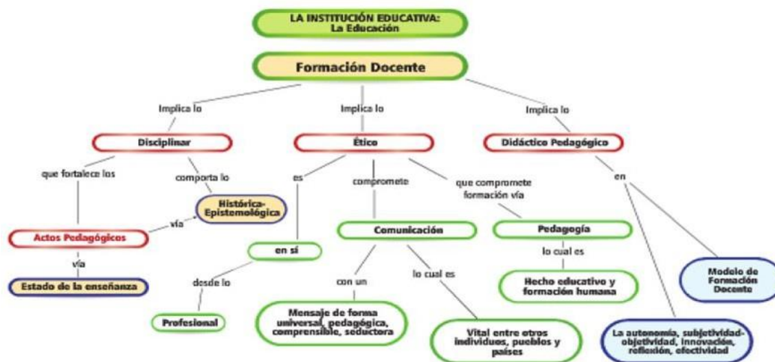
Figura 2. componentes didáctico-pedagógicos de la formación docente