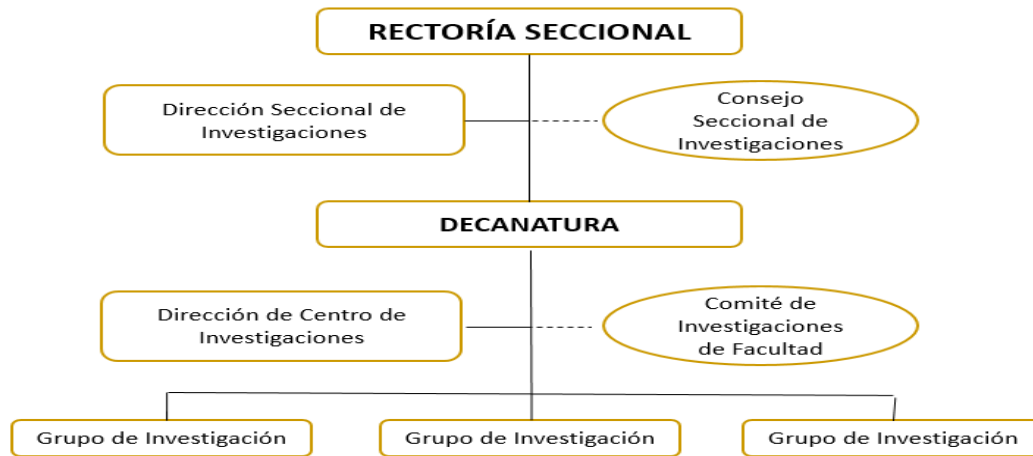
Figura 5. Estructura administrativa de investigación en la Universidad Libre