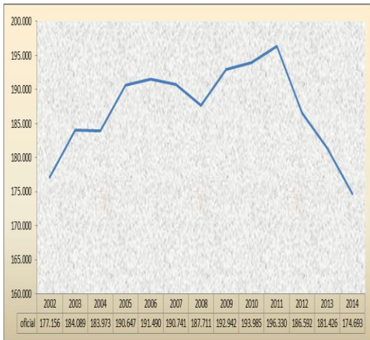
Gráfico1: Comportamiento de la matrícula oficial 2002-2014.

Fuente: Ministerio de Educación Nacional