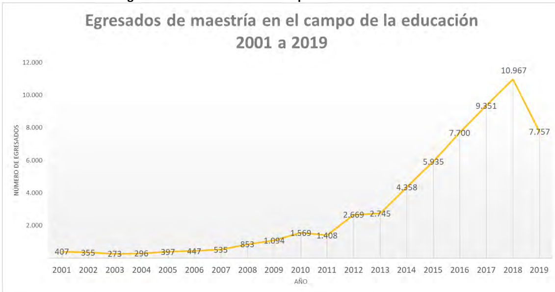
Gráfica 1. Número de egresados de maestría en el campo de la educación a nivel nacional 2001 a 2019