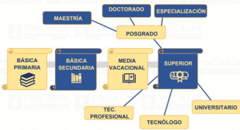
Figura 4. Educación formal

sujeción a pautas curriculares progresivas conducentes a grados y títulos. A este tipo de educación le corresponden los siguientes niveles: