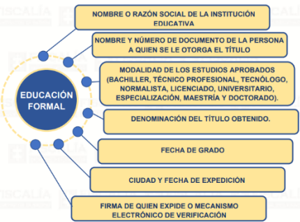
Figura 5. Formalidades de las certificaciones de Educación Formal

Ahora bien, la educación formal se acreditará mediante la presentación de certificados, diplomas, actas de grado y títulos otorgados por las instituciones que gozan de la autorización del Estado. Estos deberán contener, como mínimo, la siguiente información: