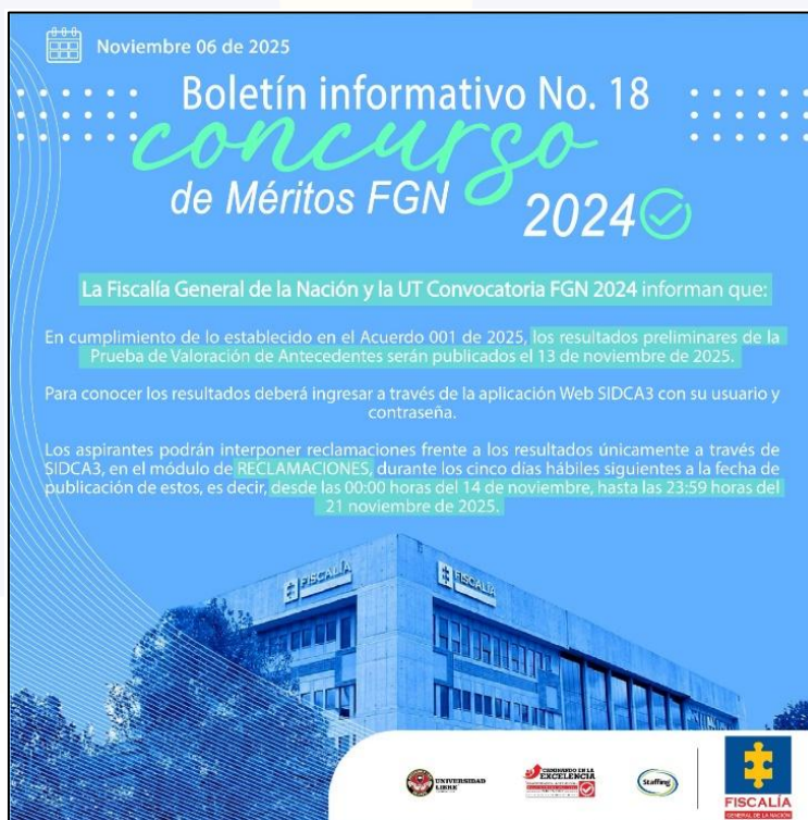
Captura de pantalla de boletín informativo número 14 publicado en SIDCA3

Ahora bien, en cumplimiento de lo enunciado hasta ahora, la Fiscalía General de la Nación y la UT Convocatoria FGN 2024 informaron, mediante el Boletín Informativo No. 18, publicado el día 06 de noviembre de 2025, que la publicación de los resultados preliminares de la prueba de Valoración de Antecedentes tendrá lugar el día 13 de noviembre del año en curso, garantizando así el conocimiento previo, amplio y transparente a todos los participantes del proceso.