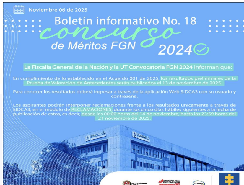
Captura de pantalla de boletín informativo número 14 publicado en SIDCA3

Ahora bien, de acuerdo a la petición radicada por usted a través del módulo de Peticiones, Quejas, Reclamos y Sugerencias (PQRS), nos permitimos afirmar que el asunto objeto de su comunicación, dada su naturaleza jurídica, corresponde a una reclamación , conforme a lo dispuesto en el Acuerdo No. 001 de 2025 y en el Decreto Ley 020 de 2014, que regulan el concurso de méritos para proveer empleos de carrera especial en la Fiscalía General de la Nación.