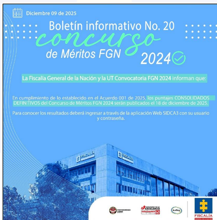
Captura de pantalla de boletín informativo número 20 publicado en SIDCA3

En cumplimiento de lo enunciado hasta ahora, la Fiscalía General de la Nación y la UT Convocatoria FGN 2024 informaron, mediante el Boletín Informativo No. 20, publicado el día 09 de diciembre de 2025, que la publicación de los puntajes consolidados definitivos tendría lugar el día 18 de diciembre del año en curso, garantizando así el conocimiento previo, amplio y transparente a todos los participantes del proceso.