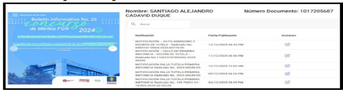
Captura de Pantalla aplicativo web SIDCA3

“Así mismo, se señala que, con la publicación, se remitió una notificación a “a los participantes del concurso público de méritos “FGN 2024”, en el empleo de Fiscal delegado ante los Juzgados Penales del Circuito Especializados, código de empleo I-102-M-01-(419), indicándoles el link de consulta, a la cual pueden acceder ingresando a la aplicación SIDCA3 con su usuario y contraseña. Lo anterior, con el propósito de garantizar el conocimiento de la acción., tal como se evidencia en la siguiente imagen: