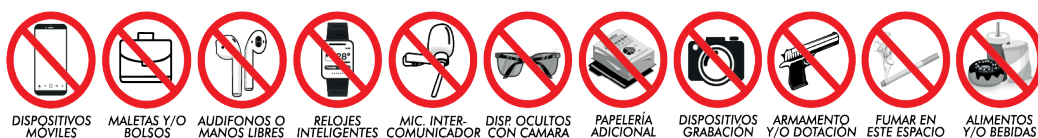
Ilustración 2. Elementos NO permitidos en la jornada de acceso

Es importante tener en cuenta que, durante la jornada de acceso a la Prueba de Ejecución, el personal de apoyo logístico realizará verificaciones aleatorias para asegurar el estricto cumplimiento de las prohibiciones establecidas. En este sentido, el personal encargado podrá solicitarle al aspirante que le muestre los elementos que tenga en los bolsillos, que se retire gorras, que se recoja el cabello y que se deje visibles las orejas, los antebrazos y tobillos.