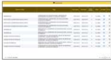
Captura de pantalla de la documentación cargada por el aspirante en el módulo de experiencia