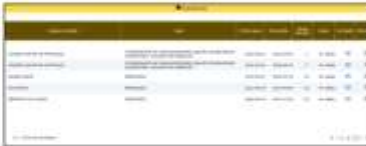
Captura de pantalla de la documentación cargada por el aspirante en el módulo de experiencia