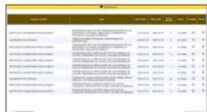
Captura de pantalla de la documentación cargada por el aspirante en el módulo de experiencia