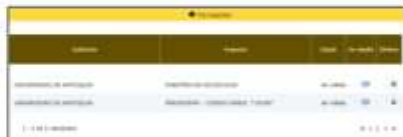
Captura de pantalla de la documentación cargada por el aspirante en el módulo de formación

En este orden, se aclara que la documentación cargada por el accionante para la etapa de Verificación de Requisitos Mínimos es la siguiente: