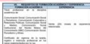
Captura de pantalla del Aplicativo MEFCL

Así las cosas, se dispone que, los criterios a valorar en la Etapa de Verificación de Requisitos Mínimos se encuentran contemplados en el numeral 3 del Anexo Técnico del Acuerdo del Proceso de Selección; y por su parte, los requisitos solicitados por el empleo al cual se inscribió el aspirante se encuentran definidos en el Manual Específico de Funciones y Competencias Laborales (MEFCL), transcritos en la correspondiente OPEC, tal y como se establece a continuación: