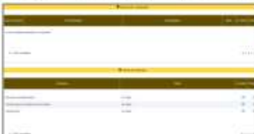
Captura de pantalla de la documentación cargada por el aspirante en el módulo de producción intelectual y de otros documentos.