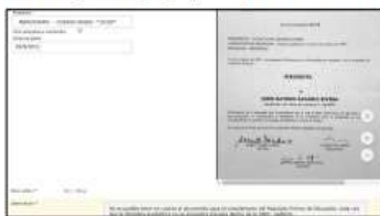
Captura de pantalla documento cargado en el módulo de educación

Ahora bien, se aclara que, revisados nuevamente los folios cargados en el módulo de educación, dentro del perfil del aspirante en SIMO, se observa que el tutelante aportó el Título de Periodista, otorgado por UNIVERSIDAD DE ANTIOQUIA, el día 26/8/2011, el cual NO puede ser validado en la Etapa de Verificación de Requisitos Mínimos puesto que no se encuentra contemplado dentro de las disciplinas académicas solicitadas por el empleo , tal y como puede visualizarse a continuación: