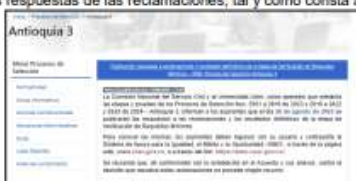
Captura de pantalla de la página web de la CNSC

Así las cosas, se dispone que, al respecto, la Comisión Nacional del Servicio Civil, mediante aviso informativo publicado en la página web del Proceso de Selección, comunicó a los aspirantes que el día 28 de agosto de la presente anualidad sería publicadas las respuestas de las reclamaciones, tal y como consta a continuación: