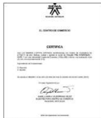
Capturas de pantalla documento cargado en el módulo de educación

Así pues, advierte que, en primer lugar, y en relación con la afirmación de la accionante, quien sostiene que la CNSC incurrió en un error al no valorar el título adicional en Comunicación Social – Periodismo bajo la alternativa de “título de posgrado”, precisó que no hay lugar a la aplicación de equivalencias en esta etapa, toda vez que, de acuerdo con lo establecido en el Anexo Técnico, estas se aplican única y exclusivamente para suplir un requisito que no se encuentra acreditado.