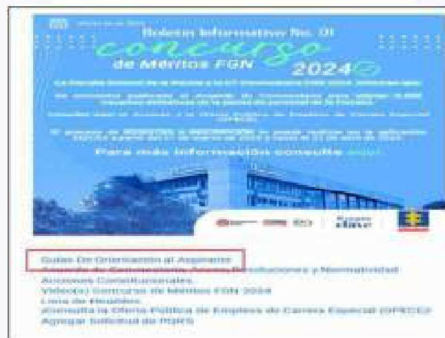
Imagen tomada desde la aplicación SIDCA3

Ahora bien, resulta pertinente aclarar que usted, para subir los documentos en debida forma, debía seguir las instrucciones de la Guía de Orientación al Aspirante para el Registro, Inscripción y Cargue de Documentos, la cual se encuentra publicada desde el 6 de marzo de 2025 y que puede encontrar accediendo a SIDCA3 desde cualquier navegador y dando clic en la “Guía de Orientación al Aspirante” , como se muestra a continuación: