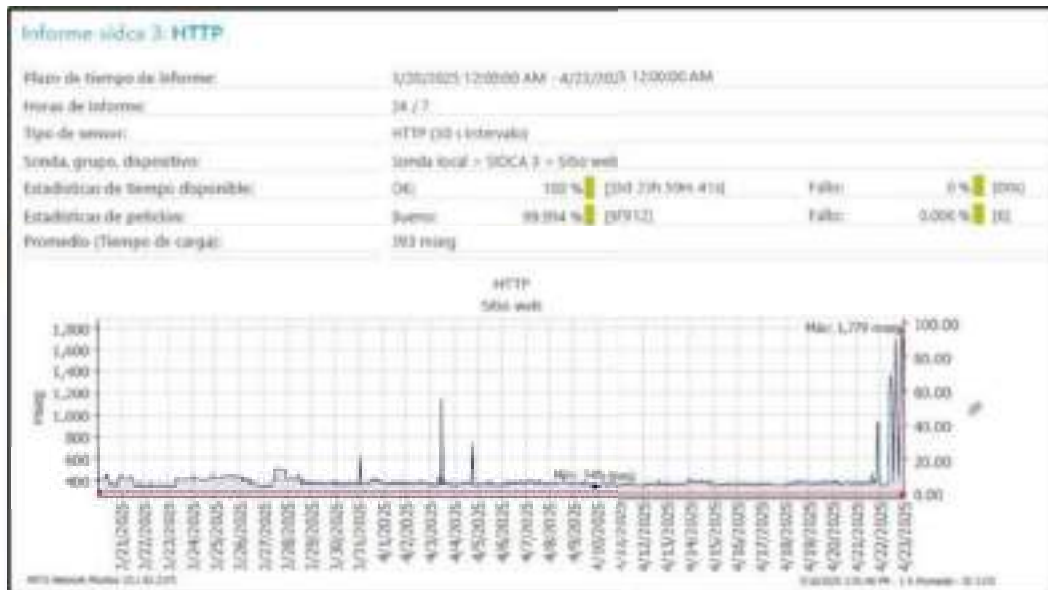
Monitoreo HTTP sitio web sidca3.unilibre.edu.co

El reporte de comportamiento de la aplicación permite evidenciar la funcionalidad constante de SIDCA3, reflejando una presencia baja de los aspirantes durante la mayoría del tiempo, circunstancia que facilitaba el cargue de documentos. Con base en lo anterior, el tiempo de carga promedio durante este periodo, fue de 394 milisegundos. Además, también refleja que durante los días finales de la convocatoria (21 y 22 de abril), hubo picos que alcanzaron hasta 3 858 milisegundos, coincidiendo con el aumento del tráfico de usuarios, circunstancia que corrobora la concurrencia indicada.