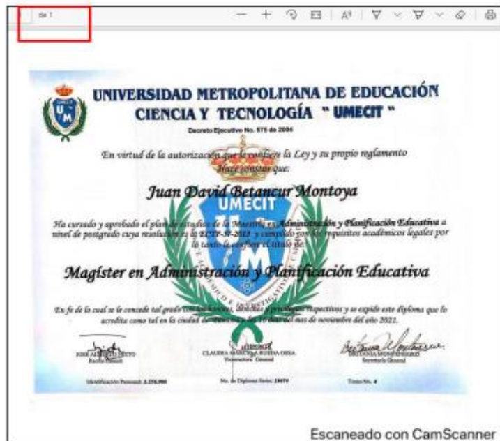
Captura de pantalla documento cargado en el módulo de educación

Sin embargo, a pesar de dichas exigencias, el demandante solamente presentó el diploma de grado, si cumplir con los requisitos anteriores, tal como lo informaron la COMISIÓN NACIONAL DEL SERVICIO CIVIL - CNSC – y UNIVERSIDAD LIBRE, a saber: