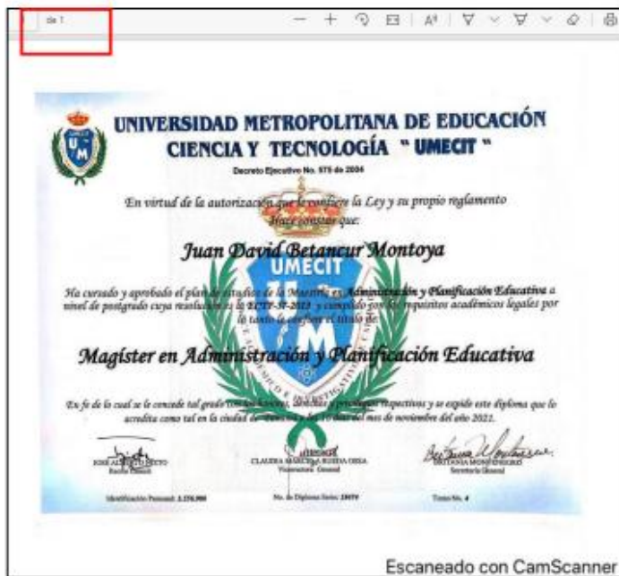
Captura de pantalla documento cargado en el módulo de educación

Maestría en Administración y Planificación Educativa, otorgado por Universidad Metropolitana de Educación Ciencia y Tecnología – UMECIT - el día 16 de noviembre de 2021, sin que se aportara el apostille y/o la convalidación expedida por el Ministerio de Educación, razón por la cual, no puede ser tenido en cuenta para generar puntaje en la prueba, a saber: