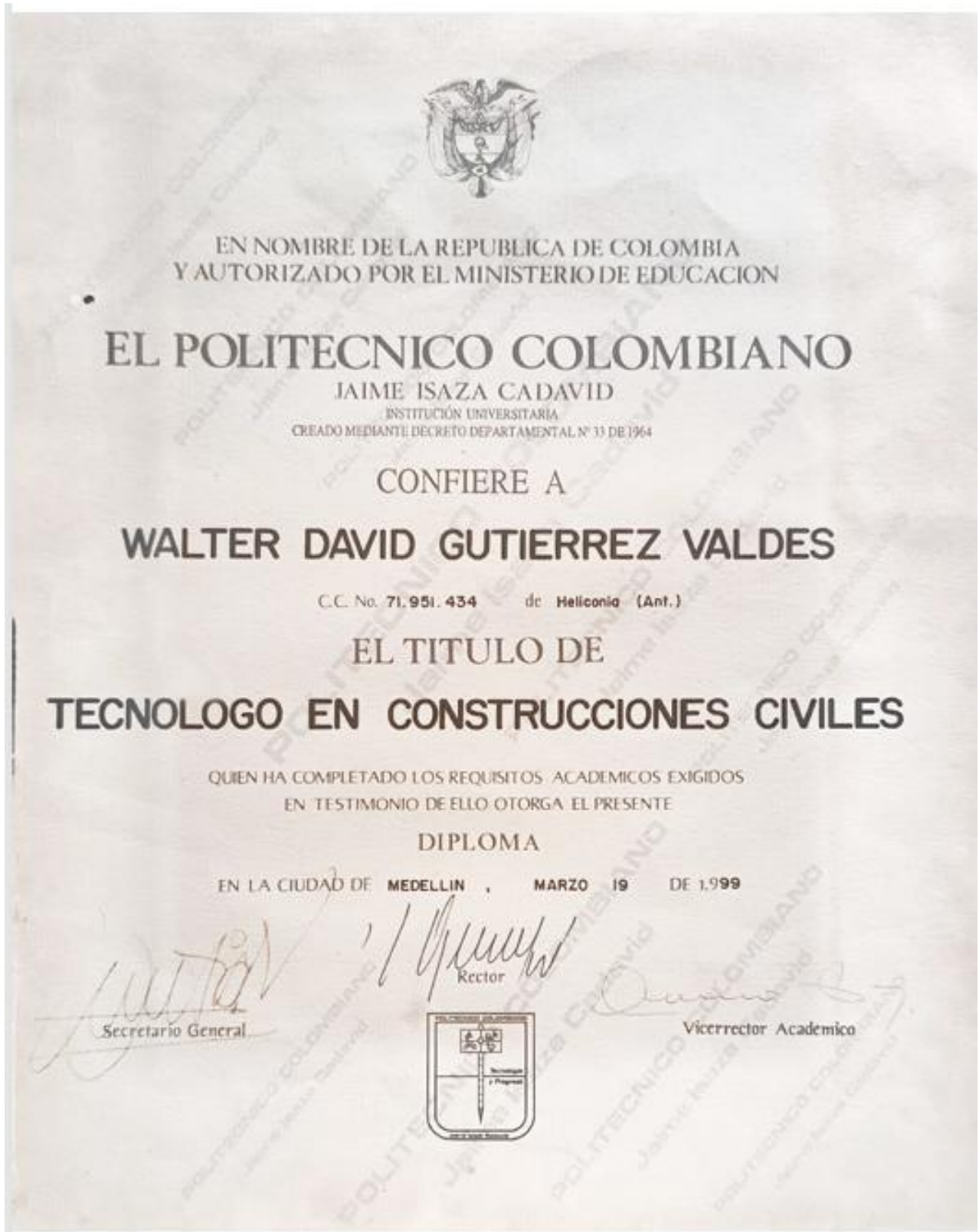
Ilustración 6. Título Tecnólogo en construcciones civiles