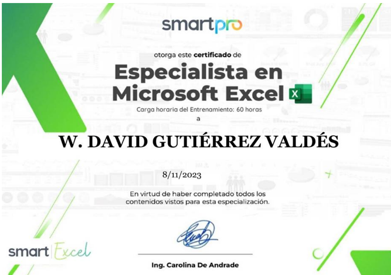
Ilustración 9. Certificado Microsoft Excel