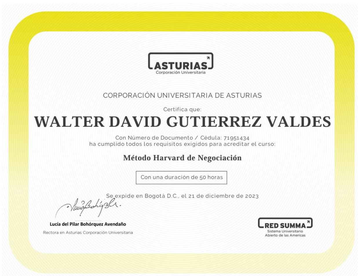
Ilustración 8. Certificado Método negociación Harvard