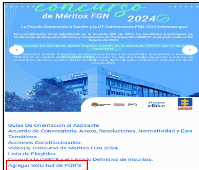
Captura de pantalla tomada a SIDCA3

La siguiente imagen refleja las dos opciones que tiene entre el registro de PQR'S o la consulta de la respuesta: